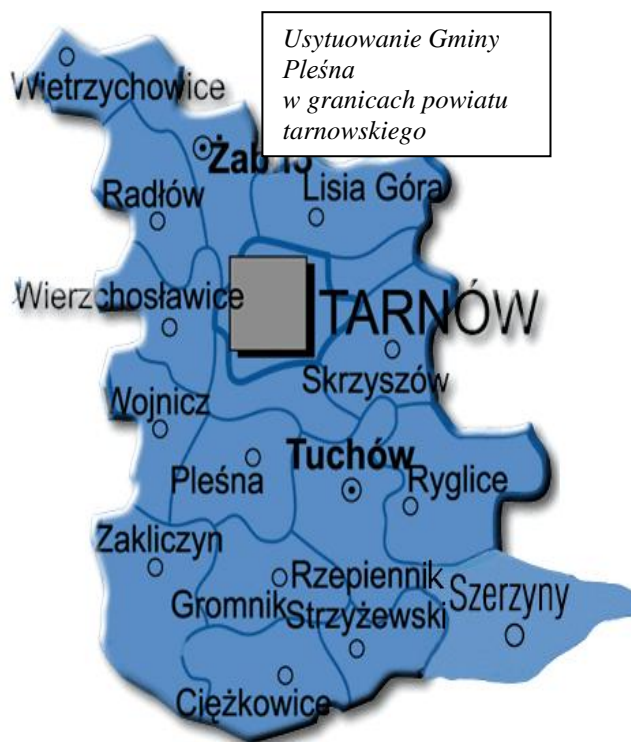
Usytuowanie Gminy Pleśna w granicach powiatu tarnowskiego